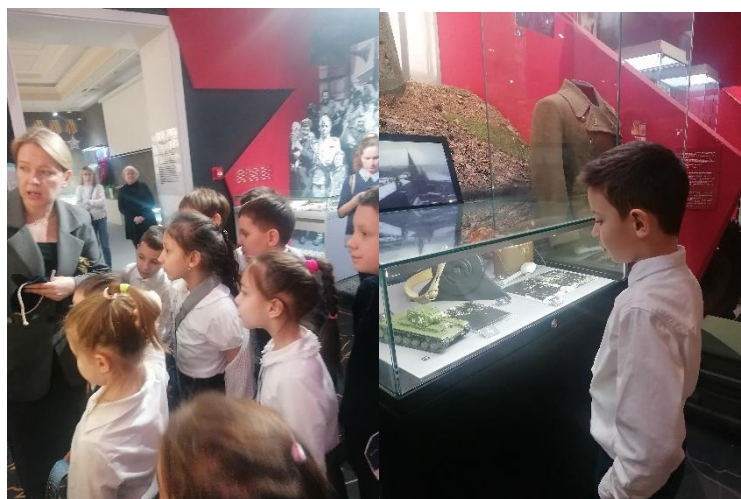
Музей – мемориал Великой Отечественной войны

Конференции предшествовала кропотливая работа учителей с учениками: в весенние каникулы ребята прочитали несколько книг по данной теме, в каждом классе проводились классные часы - «Час Победы».